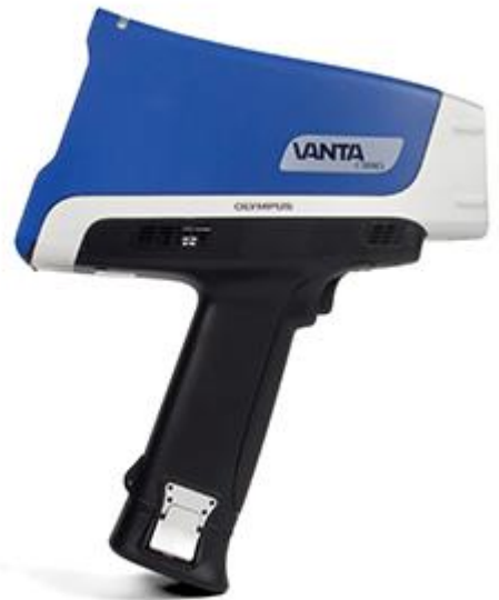
Vanta分析仪通过了从4英尺高处坠落的测试。