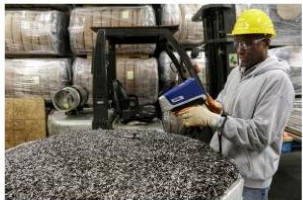
虽然废料场的环境可谓极为严酷，但是 Vanta 分析仪可以完全迎接这种挑战。

(MIL-STD-810G) 中的坠落测试，从而有助于防止仪器损坏。配备含 25 种或更多元素的标准软件包，可使用户快速测量各种合金和金属，例如：非铁性合金，低合金钢，铝合金和轻合金，铜合金，贵金属，汽车催化剂，电子元件，玻璃。