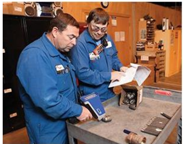
Vanta分析仪可为材料验证程序提供资产完整性信息。